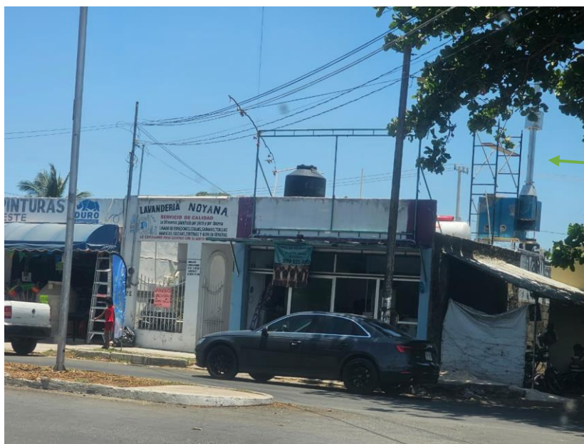
Ilustración 2. Vista de la chimenea