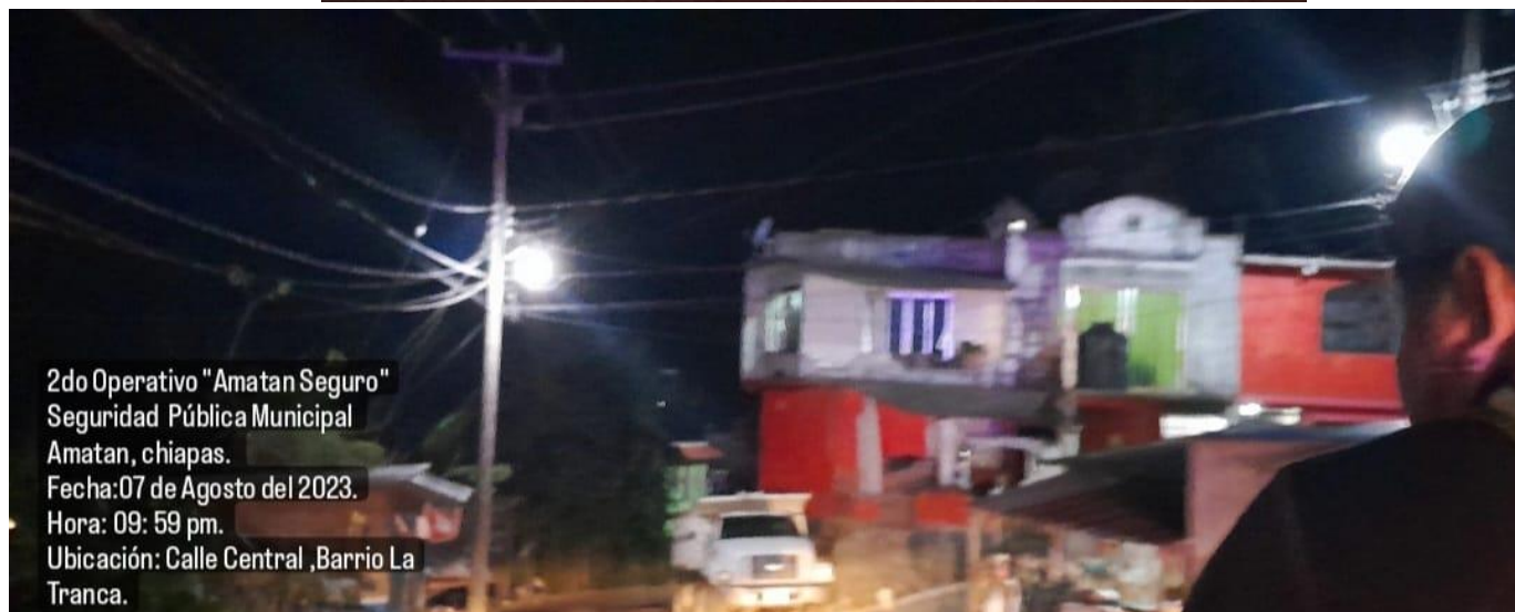
2do Operativo "Amatan Seguro" Seguridad Pública Municipal Amatan, chiapas. Fecha: 07 de Agosto del 2023. Hora: 09: 59 pm. Ubicación: Calle Central ,Barrio La Tranca.