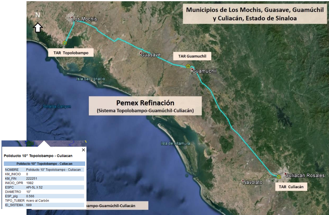
Figura 2. Sistema de transporte Topolobampo-Guamúchil-Culiacán

El sistema de transporte atraviesa los municipios de Ahome, Guasave, Salvador Alvarado, Mocorito y Culiacán en el estado de Sinaloa.