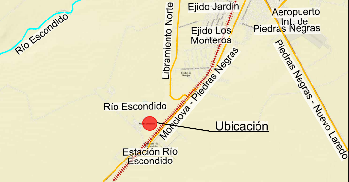
Croquis de Localización