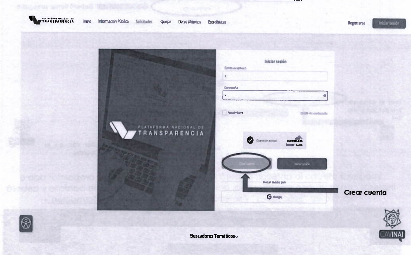
Imagen 1 (Dar clic en " Crear cuenta ")

Guadalupe Victoria #7 esq. Francisco Javier Clavijero Col. Centro, Xalapa, Ver. C.P. 91000 (228) 8420270