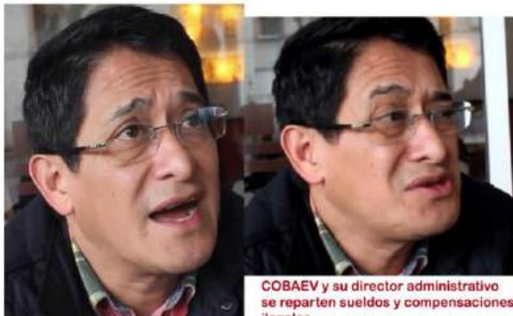
COBAEV y su director administrativo se reparten sueldos y compensaciones ilegales

Cuando Alejandro de la Cruz Garnica Fernández llegó al COBAEV, despidió a 200 supuestos aviadores, pero eso nunca se vio reflejado en la disminución de lo que se gasta en la nómina. Y esta información proviene de datos públicos, pues en el 2020, el Colegio gastó en salarios y prestaciones $1,483 millones de pesos y al año siguiente (2021) ese gasto subió a $1,507 millones de pesos.