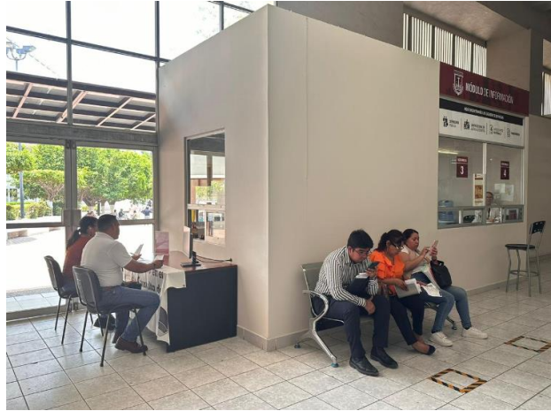
Módulo de Información