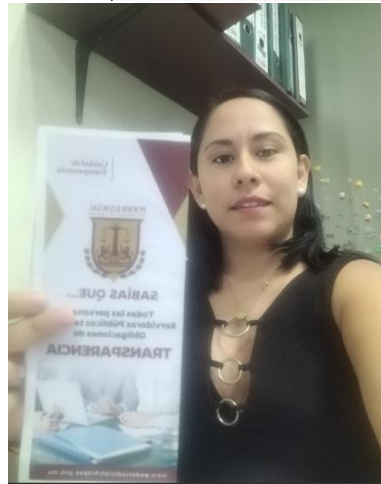
Trípticos de Información