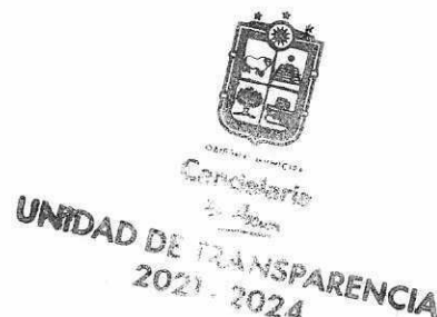
Ing. Reynaldo Reyes Chable Titular de la Unidad de Transparencia del Municipio de Candelaria.