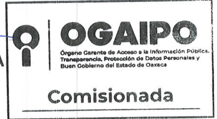
C. CLAUDIA IVETTE SOTO PINEDA COMISIONADA