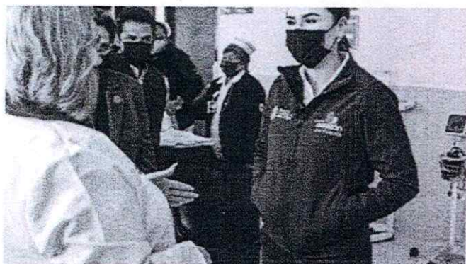
La Gobernadora y el Director del IMSS hicieron un recorrido por el predio donde este 2023 habrá un nuevo hospital regional en la ciudad de Ensenada.