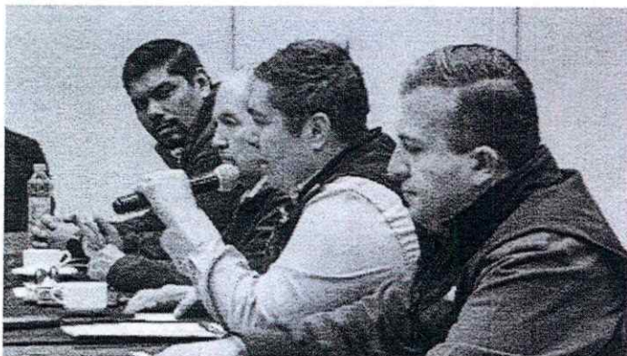
El Secretario del Agua se reunió con el Presidente del CCEE y representantes de la industria de la construcción en la localidad