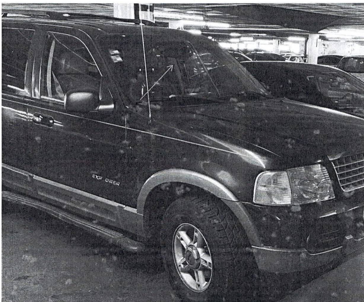
Anexo. Accesibilidad y no discriminación Cajones de estacionamiento para personas con discapacidad utilizados sin tarjetón vehicular de discapacidad.