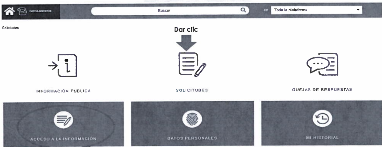
Imagen 4 (Hecho lo anterior, deberá ingresar nuevamente al link proporcionado e ingresar con su usuario y contraseña, donde le aparecerá la siguiente pantalla y deberá dar clic en solicitudes y seleccionar acceso a la información)

Guadalupe Victoria #7 esq. Francisco Javier Clavijero Col. Centro, Xalapa, Ver. C.P. 91000 (228) 8420270