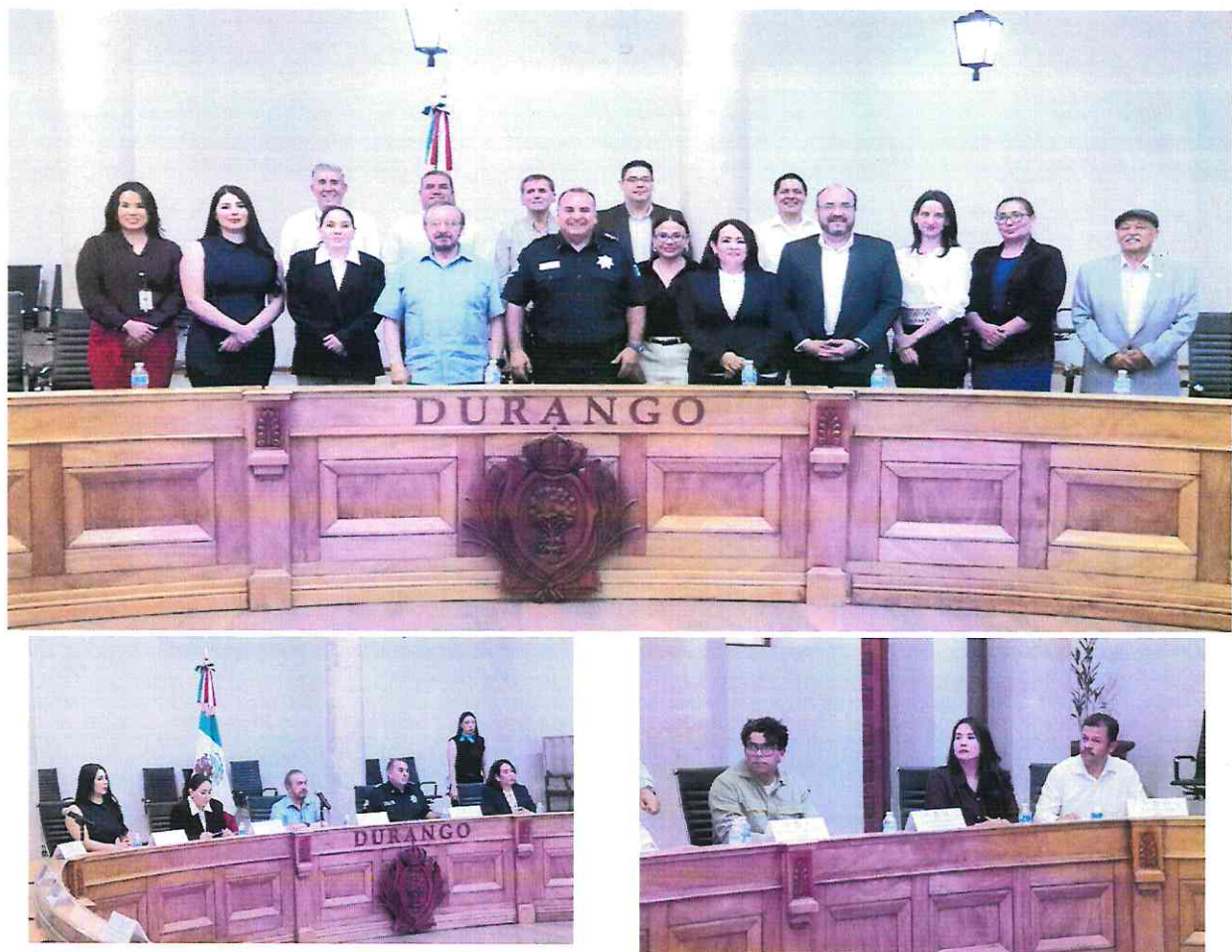
1 ra Sesión Ordinaria 2024 de la Comisión Intersecretarial para el Sistema Penitenciario del Durango