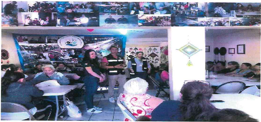
Red de Mujeres Constructoras de Paz Col Valle del Guadiana

Además, hemos conformado 5 Redes de Mujeres Constructoras de la Paz realizando 70 pláticas y talleres y 5 brigadas.