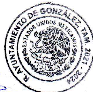
TITULAR DE LA UNIDAD DE TRANSPARENCIA