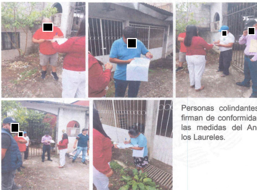
Personas colindantes que firman de conformidad con las medidas del Andador los Laureles.