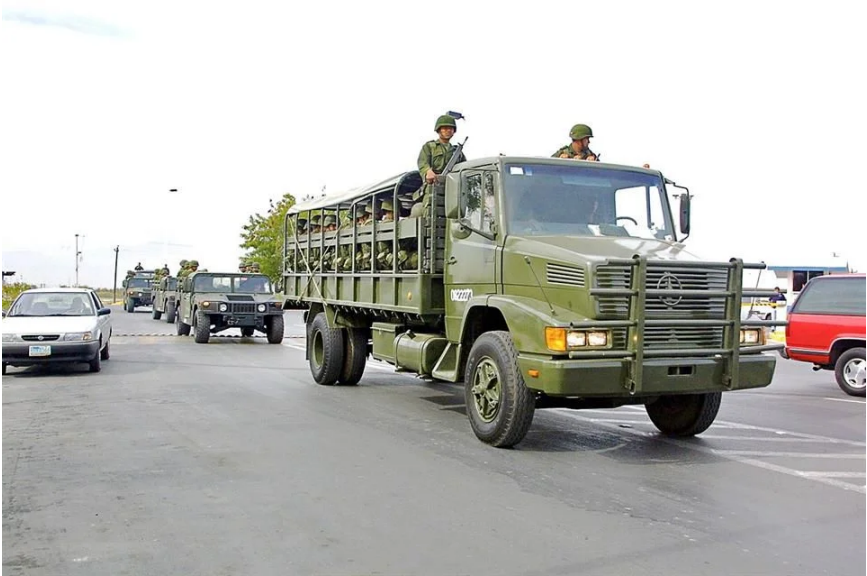
Una armadora mexicana que fabrica vehículos de paraestatal china FAW ganó contrato más grande del sexenio para proveer camiones a Sedena.

Una armadora mexicana que fabrica vehículos de la paraestatal china FAW ganó el contrato más grande del sexenio para proveer camiones a la Secretaría de la Defensa Nacional (Sedena) .