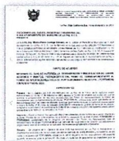
Reasignación y Modificación de Obra 2023