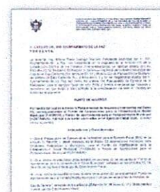
Programación de Recursos