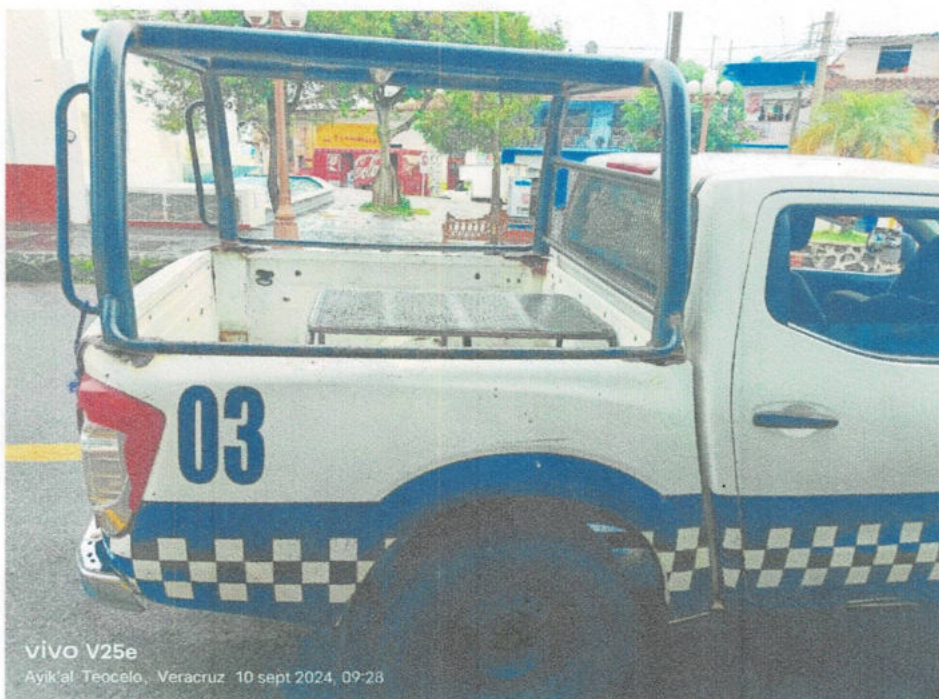
vivo V25e Ayik'al Teocelo, Veracruz 10 sept 2024, 09:28