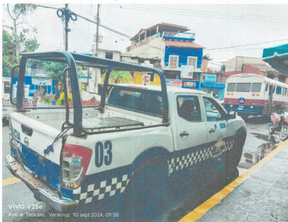
vivo V25e Ayik'al Teocelo, Veracruz 10 sept 2024, 09:30

Juan Díaz Covarrubias No. 6, Int. 201, Col. Centro, C.P. 91615 oficialmayor2225@gmail.com Tel: (228) 821 00 07 Ext. 126 Teocelo, Veracruz