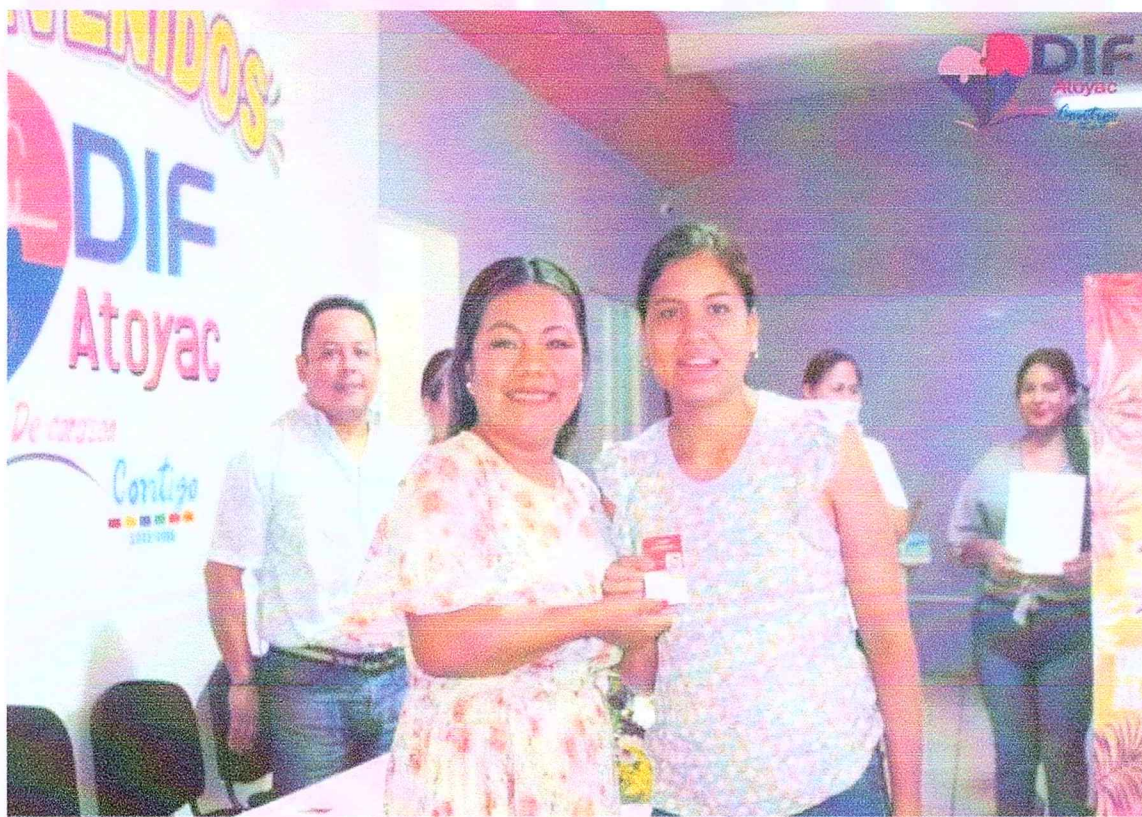
Entrega de Credenciales para personas con discapacidad.