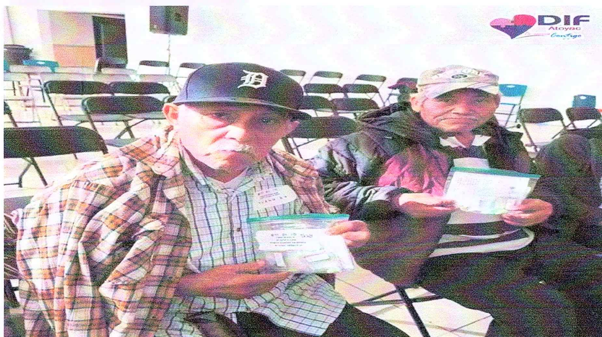
Entrega de auxiliares auditivos.