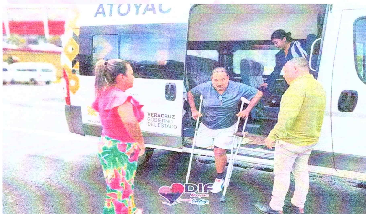
Entrega de protesis en coordinacion con SEDIF.