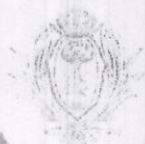
DR. ESTEBAN ALEJANDRO VILLEGAS VILLARREAL GOBERNADOR DEL ESTADO DE DURANGO

ATENTAMENTE VICTORIA DE DURANGO, DGO., 25 DE ENERO DE 2023