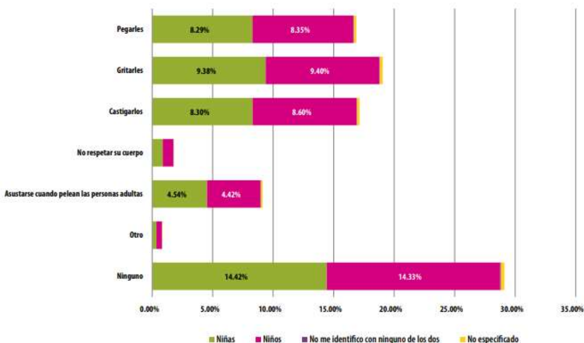
Gráfica 44. ¿Has escuchado o visto que a las niñas y a los niños los traten mal? (grupo de 3 a 5 años, por identidad sexogenérica)

Como se puede observar, de conformidad con el análisis realizado por el INE sobre dicha consulta, el 29.10% de quienes participaron en la CIJ 2021 en este rango de edad señalan no ser testigos de maltrato hacia niñas y niños. En segundo lugar, aparece el presenciar gritos (19.05%); en tercer lugar, castigos (17.13%) y, en cuarto, golpes (16.87%). Niñas y niños de 3 a 5 años dicen asustarse cuando pelean las personas adultas (9.12% de quienes respondieron). Se debe mencionar que un total de 10,700 participantes en este segmento (1.79%) expresan haber visto que no se respeta el cuerpo de niñas y niños. Para el grupo de 6 a 9 años es de gran interés la pregunta que se refiere a demandas concretas de las y los participantes en la CIJ 2021, para quienes comparten su vida cotidiana en el tema de su cuidado (como se observa en la gráfica 45.a). Se marcaron en las