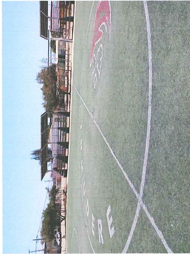
Unidad Deportiva Todos Santos