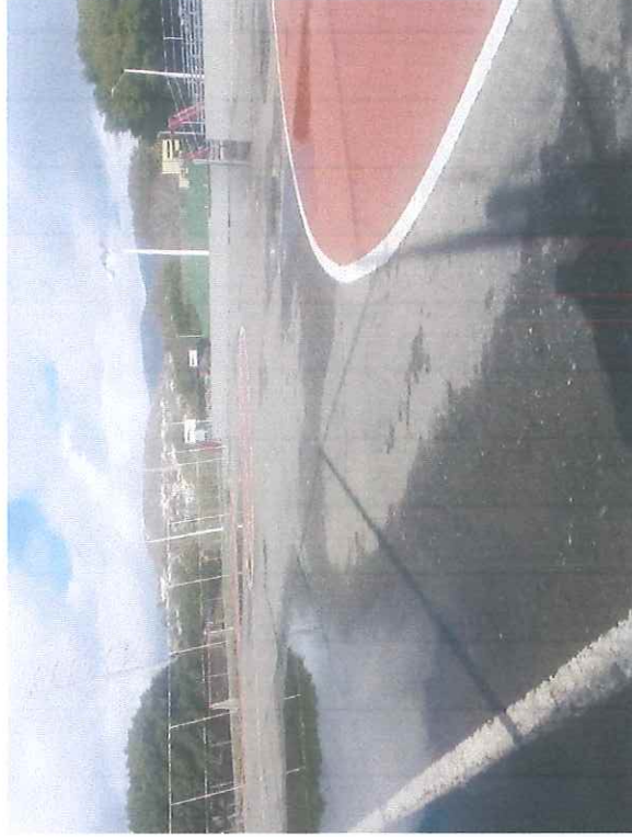
Unidad Deportiva Tres Colonias