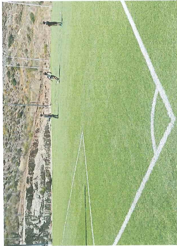
Unidad Deportiva Villas del Prado