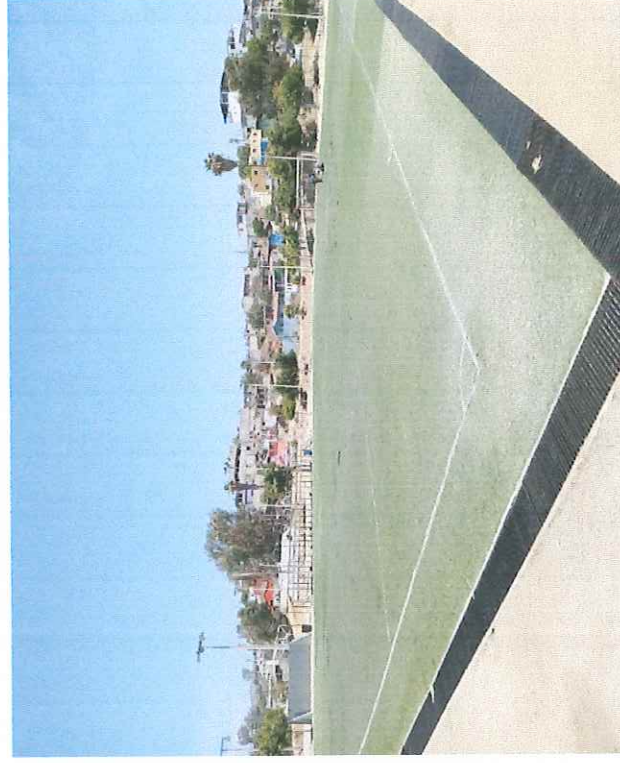
Unidad Deportiva Francisco Villa Vida Digna