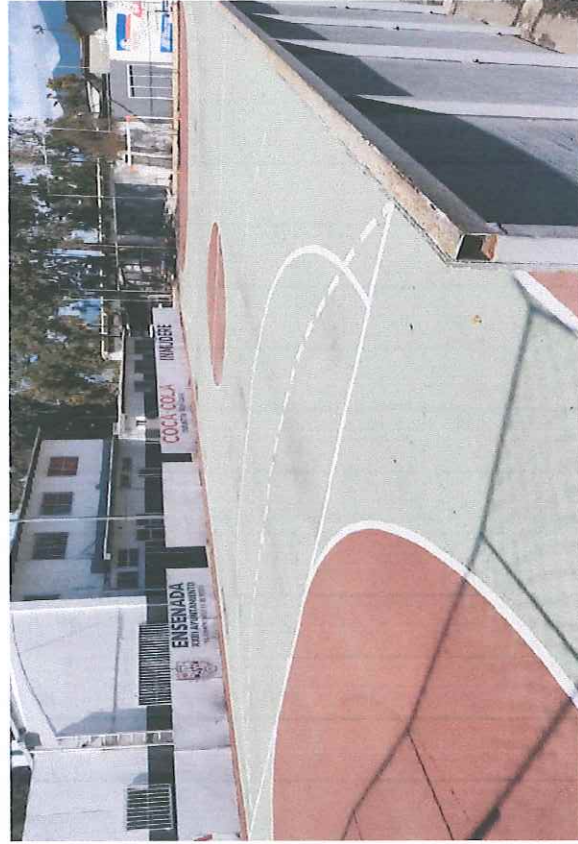
Unidad Deportiva Juan A. Rodríguez Sullivan