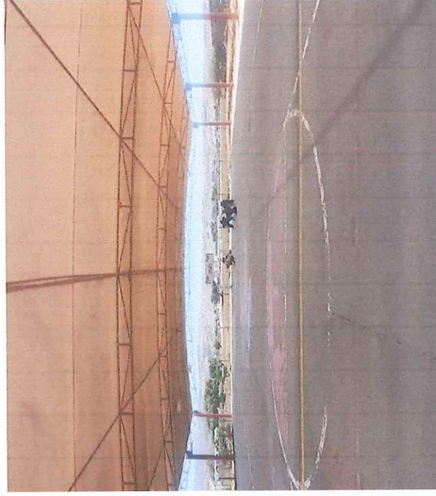
Villas del Real II