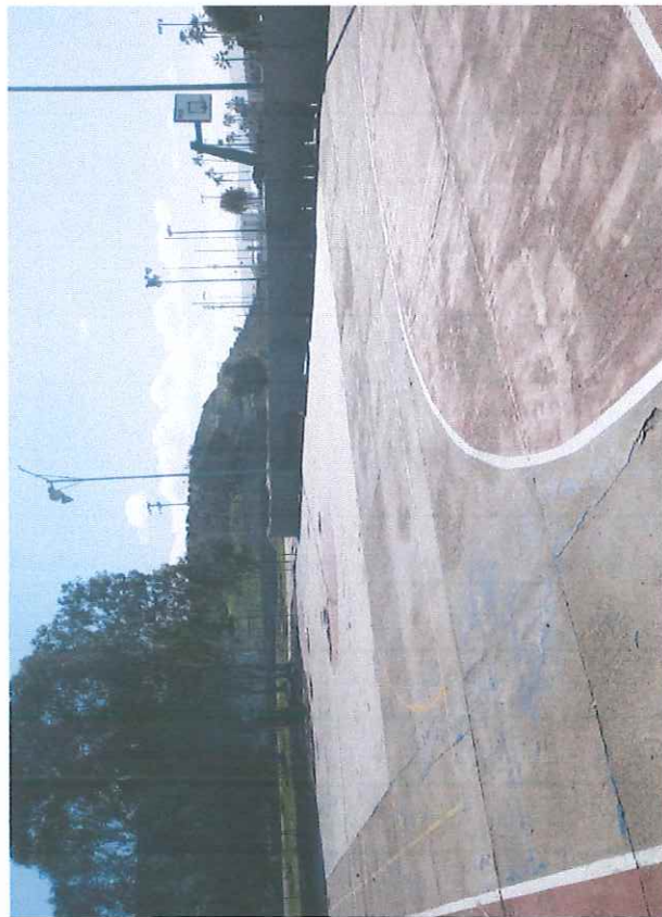
Unidad Deportiva Raúl Ramírez Lozano