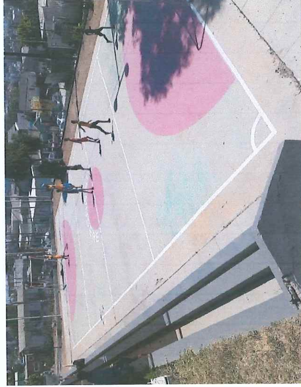
Unidad Deportiva Granjas El Gallo