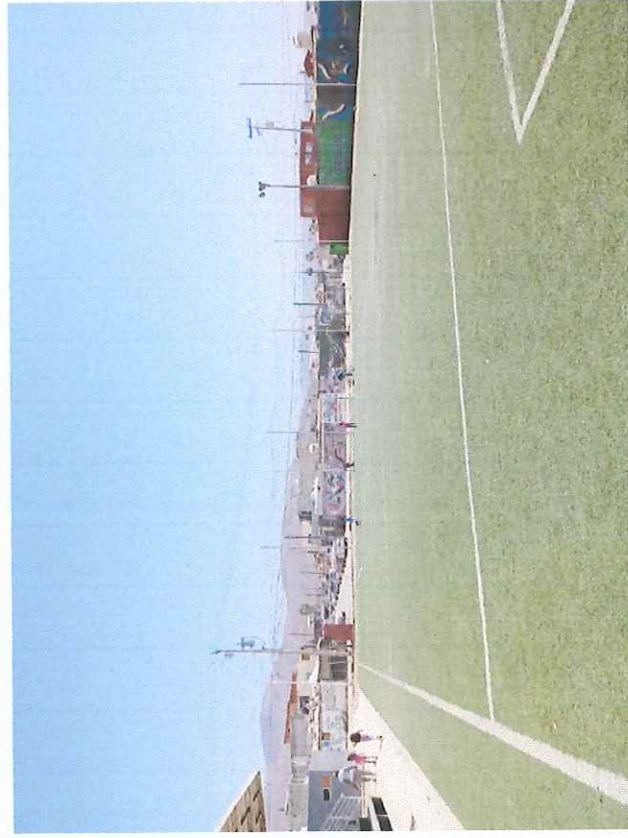
Villas del Real VI