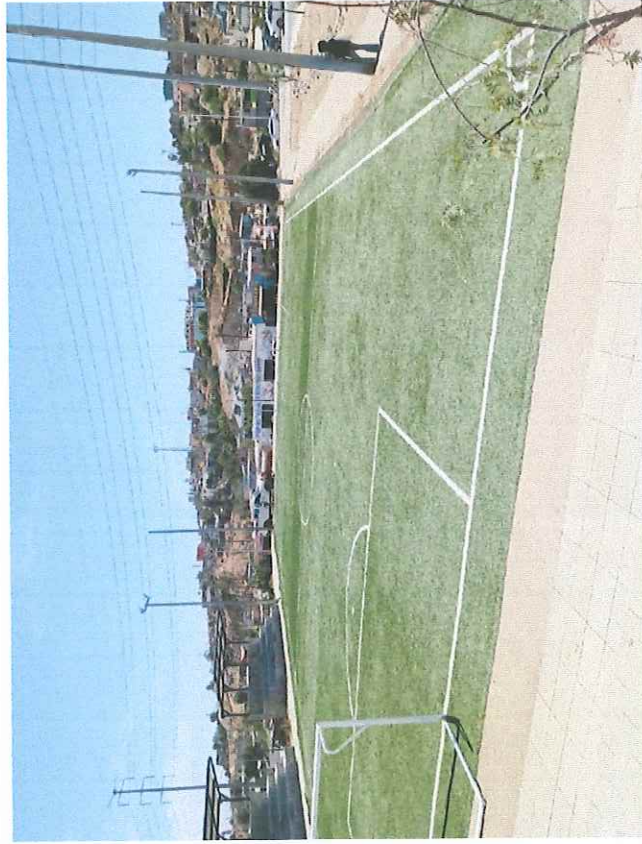
Unidad Deportiva Canchas Gemelas