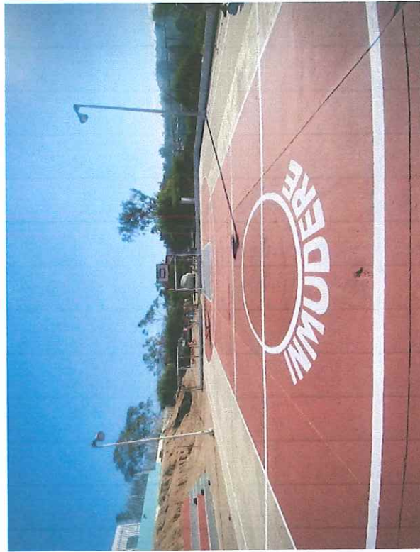
Unidad Deportiva Ruiz Cortínez