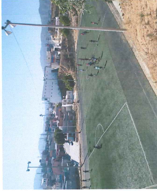
Misiones de la Presa