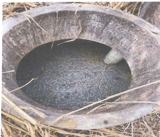
Ilustración 9.- Vista interna del tanque de desinfección azolvado.