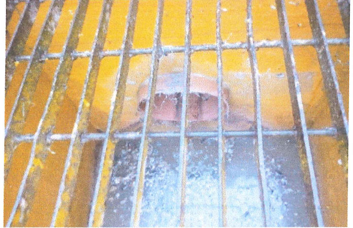
Ilustración 2.- Canal de Llegada.