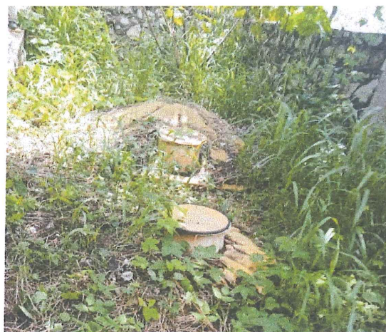
Ilustración 8.- Vista exterior del filtro entre la maleza