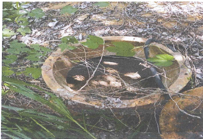
Ilustración 6.- Vista interna del Reactor anaerobio azolvado.