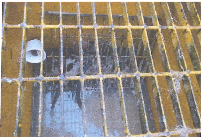
Ilustración 3.- Vista de la rejilla corroída.