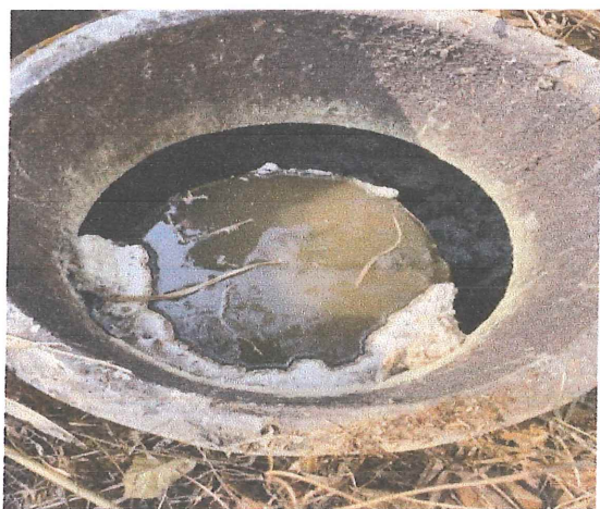
Ilustración 7.- Filtro anaerobio de flujo ascendente azolvado