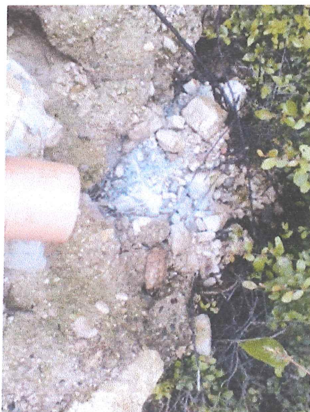
Ilustración 11.- Vista de la descarga del agua sin tratamiento.