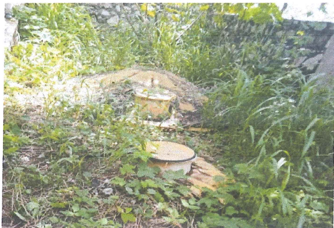
Ilustración 5.- Vista general del Reactor anaerobio, entre la maleza.