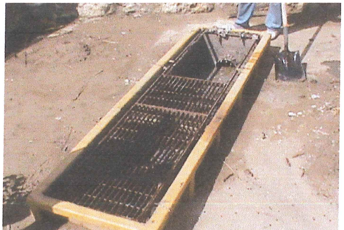
Ilustración 4.- Vista del Canal rectangular.