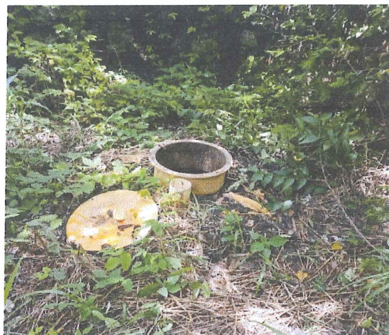
Ilustración 10.- Vista exterior del tanque de desinfección entre la maleza