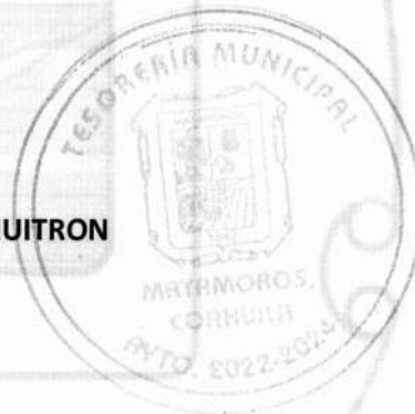
C.P. EFRAIN EDUARDO AGÜERO HUITRON TESORERO MUNICIPAL

Recibí 5/07/24 10:58 am Transparencia UT/53/2024 c.c.p. - Archivo.