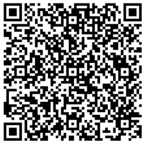
Integración de la LXXVI Legislatura del Congreso del Estado de Michoacán