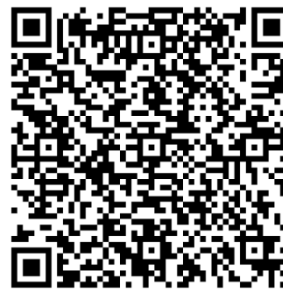
Informe de resultados de las respuestas obtenidas en las Consultas previas, libres, informadas y de buena fe a personas con discapacidad, de la población LGBTIAQ+, indígenas y migrantes, sobre la acreditación de su auto adscripción, pertenencia o vinculación a esos grupos de atención prioritaria para la postulación de candidaturas en el Proceso Electoral Local 2023 - 2024