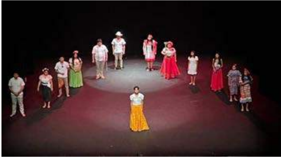
Grupo de teatro UVI Selvas