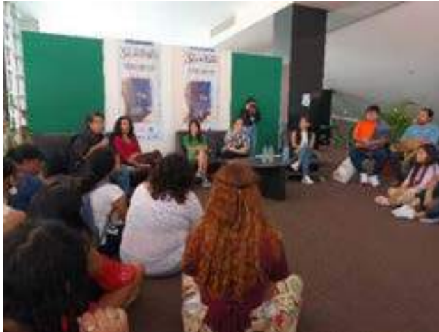
Los roles femeninos en el teatro