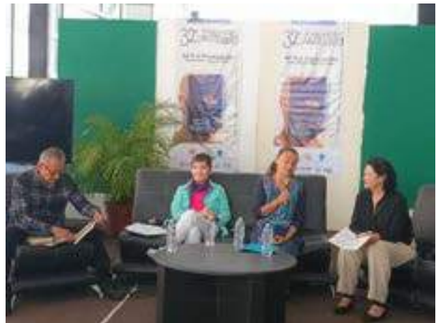
Homenaje Inmemorian Mtra. Luisa Josefina Hernández