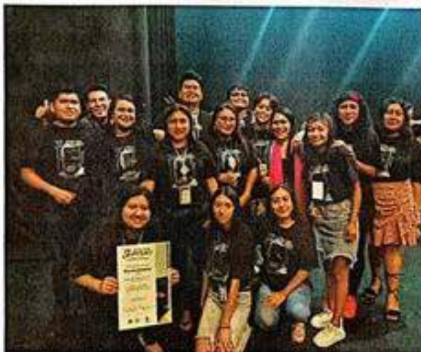
Grupo de teatro de la UVI Selvas Reconocimiento como uno de los Montajes más relevantes del 32 Festival de Teatro Universitario

Huazuntlán, Mpio de Mecayapan, Ver., a 6 de noviembre de 2023.