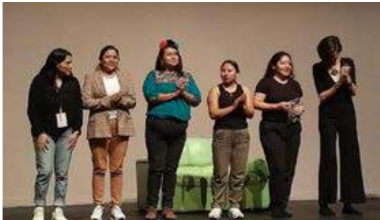
Acompañantes de los grupos de teatro de las sedes UVI