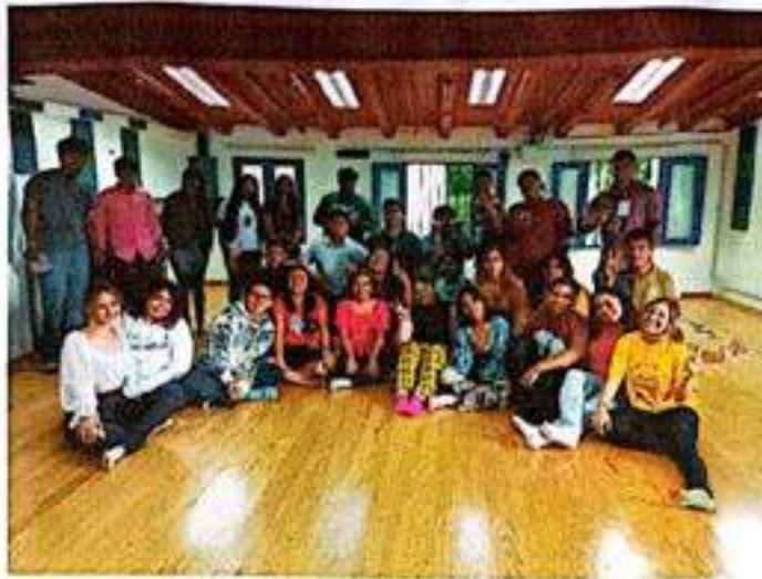
Taller "Acercamiento a la Pedagogía Teatral"