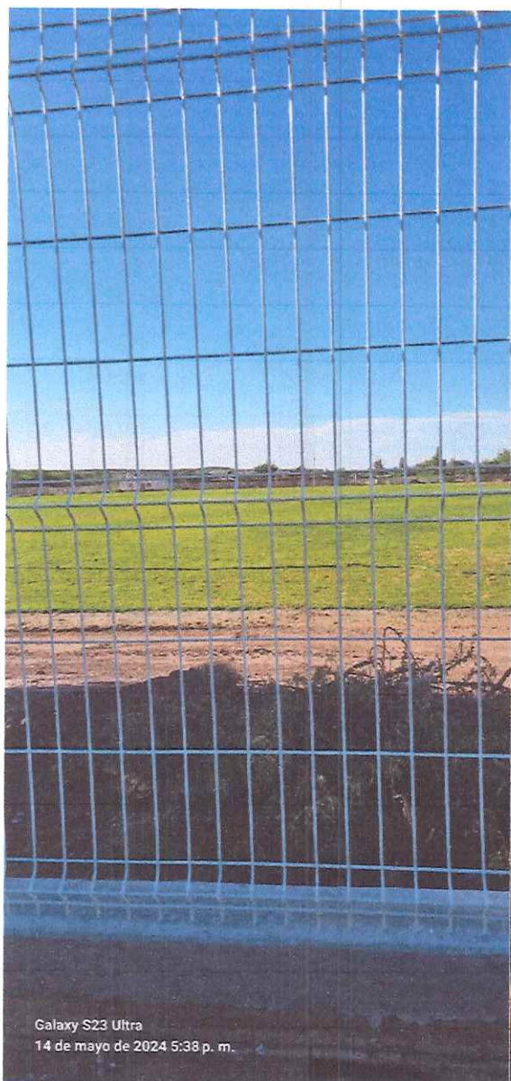
Galaxy S23 Ultra 14 de mayo de 2024 5:38 p. m.