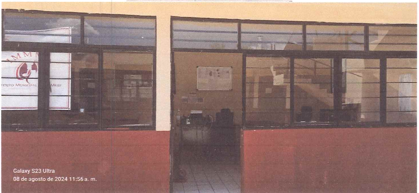
Galaxy S23 Ultra 08 de agosto de 2024 11:56 a. m.