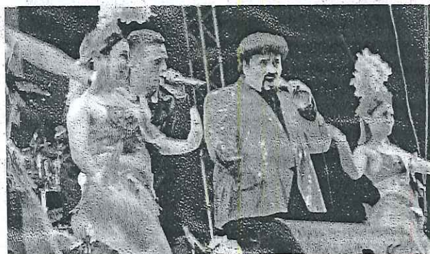
ASISTENTES DISFRUTARON de varios grupos musicales que los hicieron bailar.

Verde. Fue un evento lleno de sorpresas y mucha diversión para chicos y grandes.