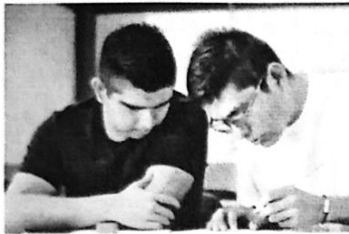
Técnico Superior Universitario en Informática