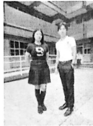
Preparatoria No. 9, Bachillerato