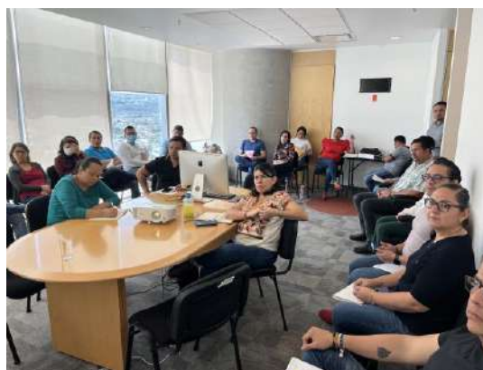
Imágenes 3 y 4: Evidencia fotográfica de la capacitación impartida al personal de la Secretaría de Economía y del Trabajo.