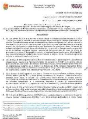
Imagen 6: Ejemplo de una de las 15 resoluciones que emitió el Comité de Transparencia de la Secretaría Ejecutiva.