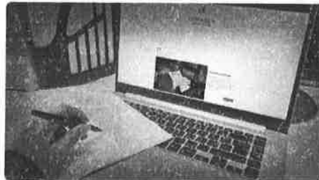
Visualización de datos

Secretaría Ejecutiva del Sistema Nacional de Seguridad Pública 20 de septiembre de 2024