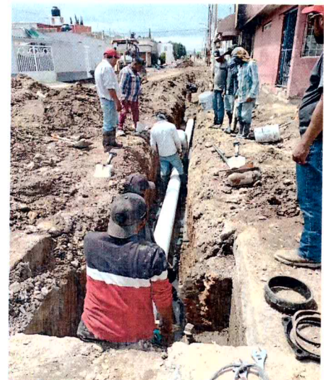
RED HIDRAULICA Y SALIDAS HIDRAULICAS