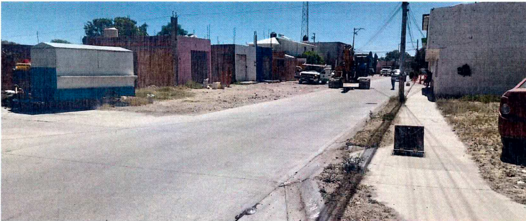
CALLE ANTES DE INICIAR LA OBRA

SE EJECUTO RED HIDRAULICA DE 8", ASI COMO DE RED SANITARIA Y CONSTRUCCION DE 5 POZOS DE VISITA, SE TRABAJO EN CORTE DE TERRENO NATURAL HASTA 240 ML Y SE SUMINISTRO BASE HIDRAULICA. ASI MISMO SE REALIZAN LOS TRABAJOS DE CONSTRUCCION DE BANQUETAS Y GUARNICIONES AMBOS DE CONCRETO, EN LOS PRIMEROS 220 ML, EN LOS CUALES YA SE REALIZO LA INTRODUCCION DE RED DE AGUA POTABLE Y SUS RESPECTIVAS SALIDAS HIDRAULICAS, LA RED SANITARIA Y LAS DESCARGAS SANITARIAS DOMICILIARIAS