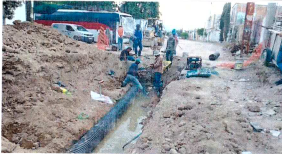
INTRODUCCION DE RED SANITARIA