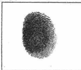
HUELLA DACTILAR (PULGAR DERECHO)