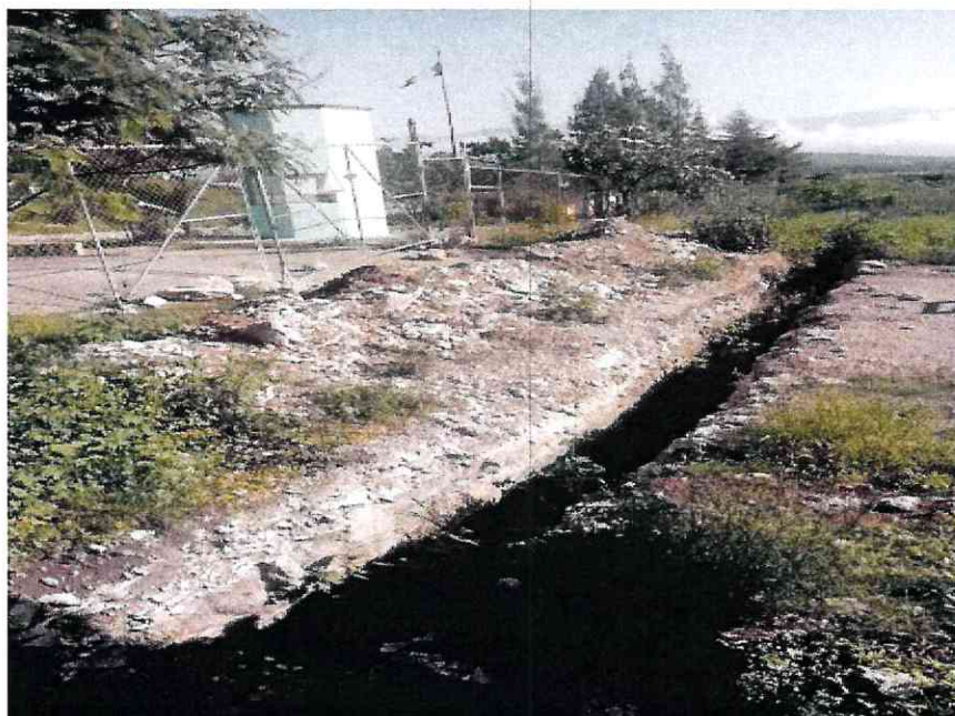
VISTA FRONTAL (ACCESO RESTRINGIDO)