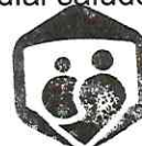
LN. JOEL ISRAEL KOH MEDINA COORDINADOR DE PLANEACIÓN Y EVALUACIÓN - UNIDAD DE ACCESO A LA INFORMACIÓN PÚBLICA DEL SMDIF

COORDINACIÓN DE PLANEACIÓN Y EVALUACIÓN-UNIDAD DE ACCESO A LA INFORMACIÓN PÚBLICA SISTEMA PARA EL DESARROLLO INTEGRAL DE LA FAMILIA EN EL MUNICIPIO DE HOPELCHÉN 2021 - 2024