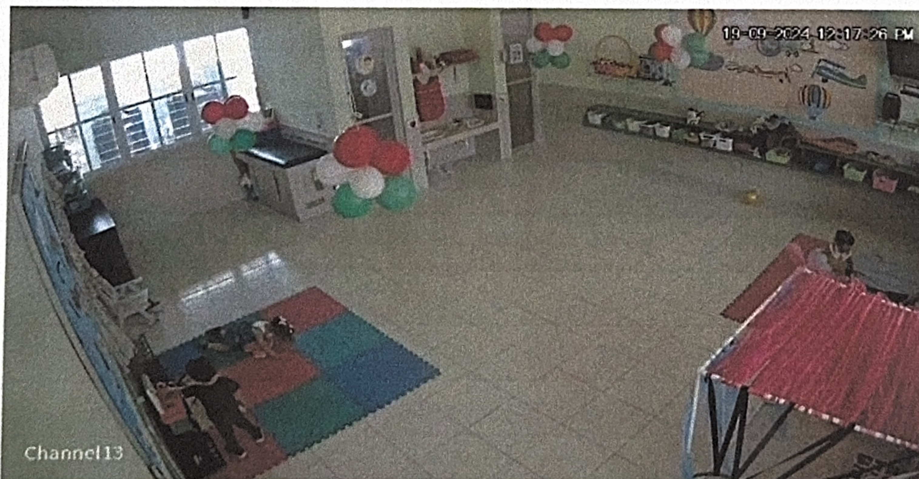
Caja registradora JUEGA ENCIMA

Directora del CAI N°5 CAI LEV VYGOSTKY TEKAX, YUCATAN