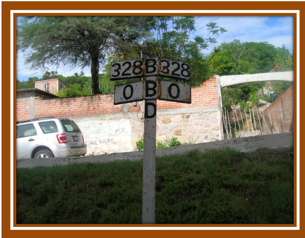
FOTO 1.- Kilometraje de línea "B" México-Nuevo Laredo e inicia desviación línea "BD".