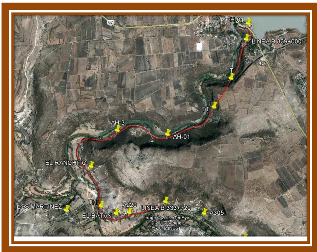
IMAGEN 1.- Ubicación Antigua línea “B” México-Nuevo Laredo (vía abandonada)

Ubicación Geográfica en base a levantamiento con GPS Magellan 76.