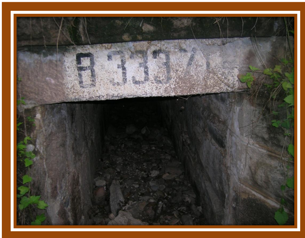
Foto2.- Kilometraje sobre alcantarilla de línea "B" México-Laredo (vía abandonada).