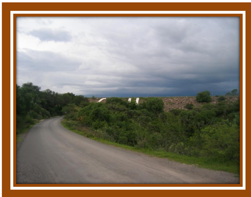
Foto 4.- Cortina Presa Ignacio Allende sobre lo que fue la línea “B” México-Laredo (vía abandonada) KM 339+000.