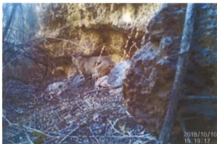
Figura 55. Lince (Lynx Rufus) captado en cámara trampa en el área del Cerro Horeb en Sierra Azul.