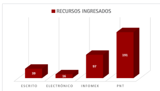
Recursos de Revisión Ingresados por medio interpuesto.

Si se requiere consultar información estadística adicional, ésta la podrá localizar a fojas de la 64 a la 70 del Informe Ejercicio 2020, al acceder a la liga antes señalada. En lo que respecta a la materia de datos personales, es importante destacar que durante el periodo que se informa, ingresaron un total de 4 (cuatro) recursos de revisión en materia de datos personales.