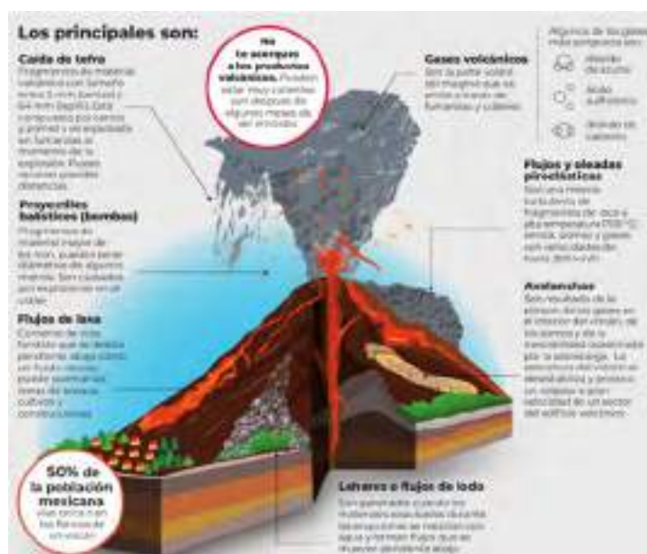
fig.4 Peligros volcánicos (CENAPRED, 2021)

Por lo general avanzan a decenas de metros por hora y llegan a recorrer varios kilómetros de distancia con respecto al volcán. Los derrames de lava destruyen todo a su paso, generan daños en viviendas, infraestructura y vías de comunicación. Por sus altas temperaturas provocan incendios en pastizales y bosques, sin embargo, no representan un grave peligro para las personas debido a su baja velocidad. Los derrames de lava son corrientes de roca fundida emitidas a elevadas temperaturas de entre 800 y 1200 °C., y pueden ser expulsadas por el cráter o fracturas en los flancos del volcán. Por lo general avanzan a decenas de metros por hora y llegan a recorrer varios kilómetros de distancia con respecto al volcán. Los derrames de lava destruyen todo a su paso, generan daños en viviendas, infraestructura y vías de comunicación. Por sus altas temperaturas provocan incendios en pastizales y bosques, sin embargo, no representan un grave peligro para las personas debido a su baja velocidad.