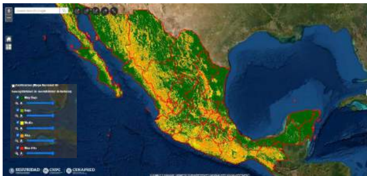
fig.1 Mapa Nacional de susceptibilidad a la Inestabilidad de Laderas, disponible en http://www.atlasmunicipalderiesgos.gob.mx/portal/fenomenos/