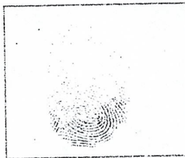
HUELLA DACTILAR (PULGAR DERECHO)