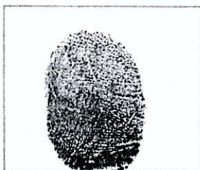
HUELLA DACTILAR (PULGAR DERECHO)