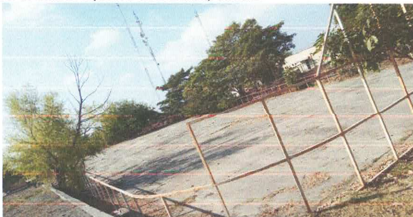
Cancha de fútbol de Unidad deportiva Cuauhtémoc, Colima: