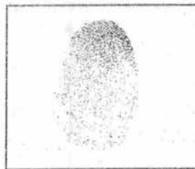
HUELLA DACTILAR (PULGAR DERECHO)