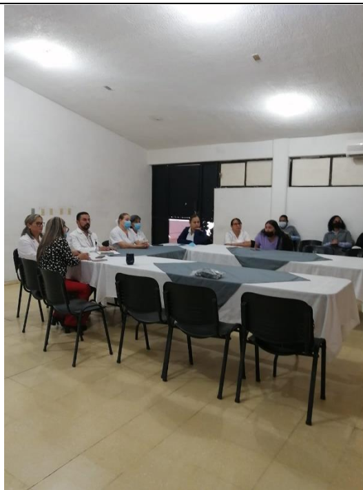
No. de Fotografía __2__