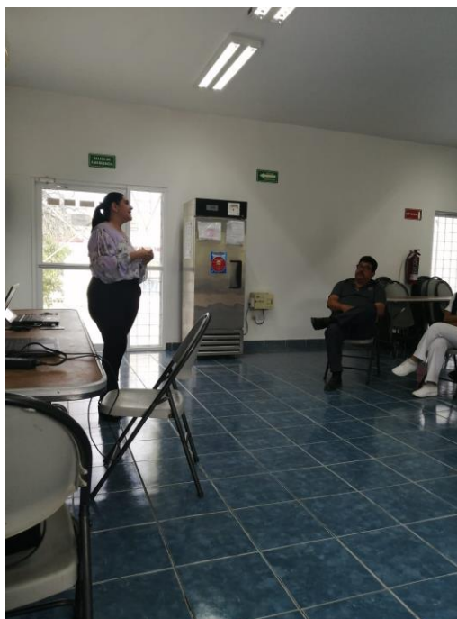
No. de Fotografía 1