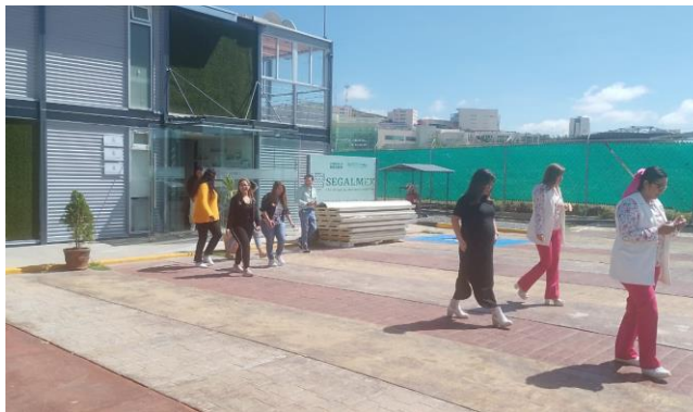
Desalojo del Personal