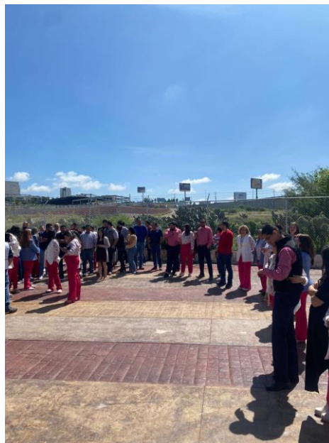
Concentración de las Personas en el Punto de Reunión