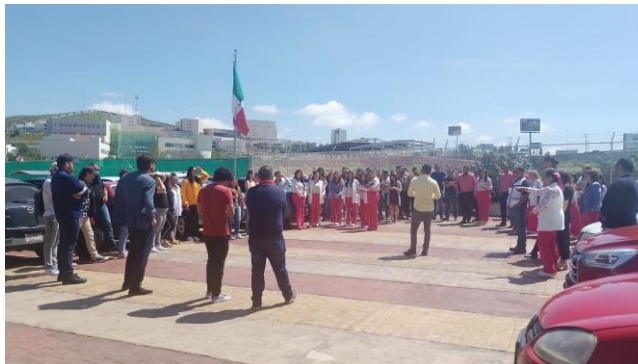
Emisión de Recomendaciones al Finalizar el Simulacro