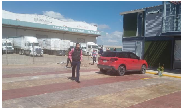
Seguimiento de la Ruta de Evacuación