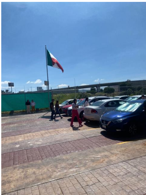
Salida de las Personas del Edificio