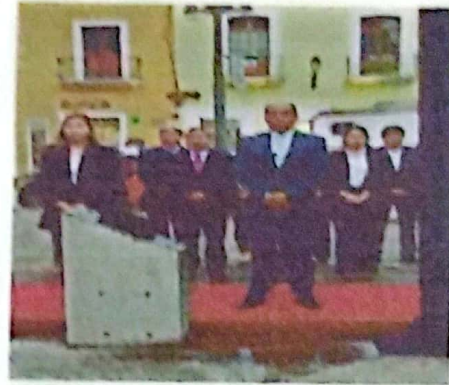
IZAMIENTO DE BANDERA