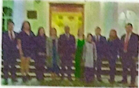
15 DE SEPTIEMBRE