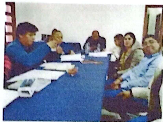
SESION EXTRAORDINARIA CABILDO