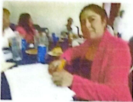
SESION DE CABILDO