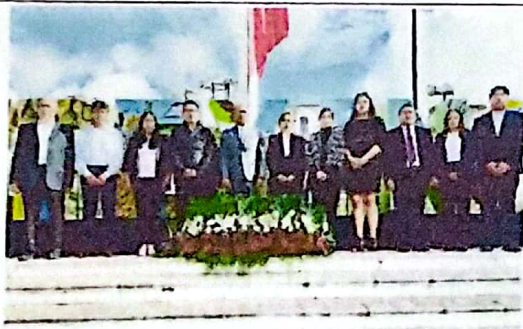
13 DE SEPTIEMBRE