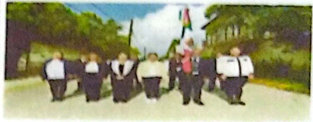
DESFILE 16 DE SEPTIEMBRE