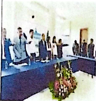
TOMA DE PROTESTA