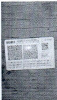
WhatsApp Image 2024-06-24 at 1.58.04 PM (1).jpeg 116K

Este correo electrónico, incluyendo en su caso, los archivos adjuntos al mismo, pueden contener información de carácter confidencial y/o privilegiada, y se envían a la atención única y exclusivamente de la persona y/o entidad a quien va dirigido. La copia, revisión, uso, revelación y/o distribución de dicha información confidencial sin la autorización por escrito del MUNICIPIO DE QUERÉTARO está prohibida. Si usted no es el destinatario a quien se dirige el presente correo, favor de contactar al remitente respondiendo al presente correo y eliminar el correo original incluyendo sus archivos, así como cualesquiera copia del mismo. Mediante la recepción del presente correo usted reconoce y acepta que en caso de incumplimiento de su parte y/o de sus representantes a los términos antes mencionados, el MUNICIPIO DE QUERÉTARO tendrá derecho a los daños y perjuicios que esto le cause.