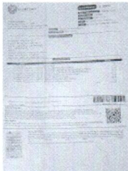
WhatsApp Image 2024-06-24 at 1.58.00 PM.jpeg 225K