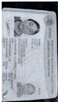
WhatsApp Image 2024-06-24 at 1.59.03 PM.jpeg 80K