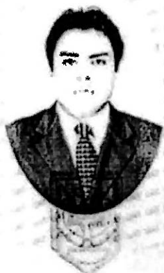
Firma del interesado

"Por la Cultura a la Justicia Social" Dado en la Ciudad de Tlaxcala de Xicohitlencatl el 15 de noviembre de 2005.