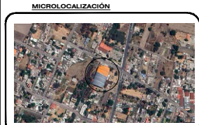
DATOS DE PROYECTO